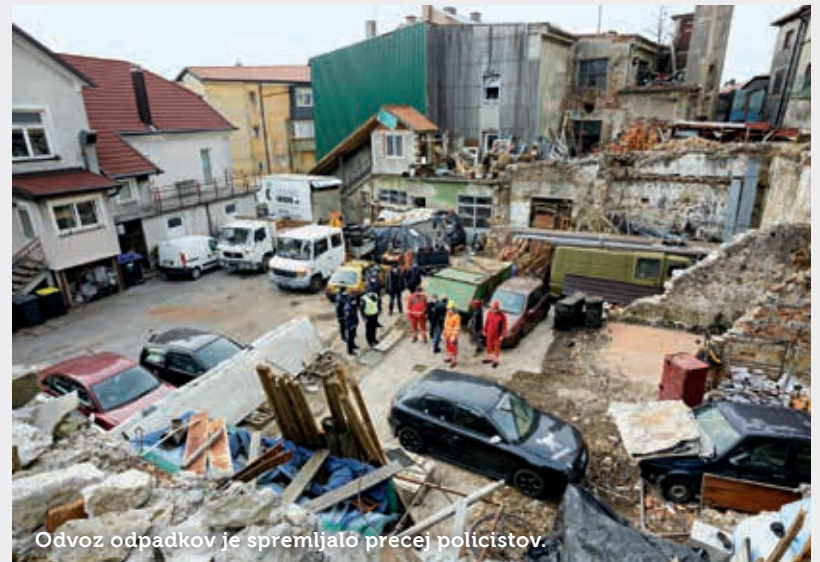
Odvoz odpadkov je spremljalo precej policistov.