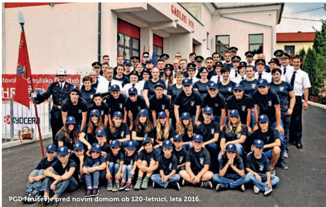
PGD Hruševje pred novim domom ob 120-letnici, leta 2016.