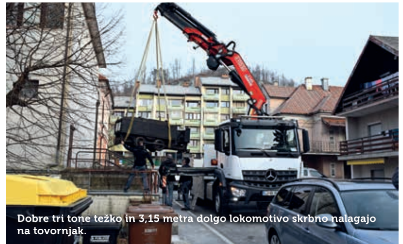
Dobre tri tone težko in 3,15 metra dolgo lokomotivo skrbno nalagajo na tovornjak.

Aprila 1957 so pri Postojnski jami staro, takrat že dotrajano lokomoti-