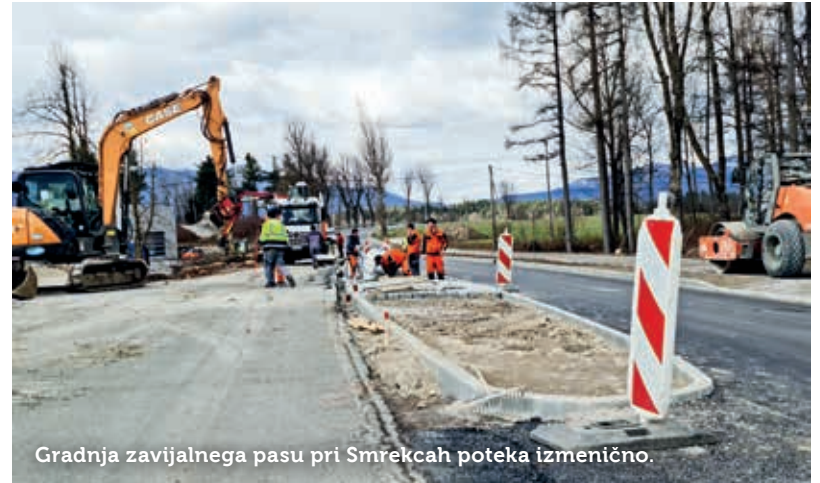
Gradnja zavijalnega pasu pri Smrekcah poteka izmenično.

Kot dodaja občinski sekretar, je treba hkrati urediti tudi obojestranski postajališči za avtobuse. Pojasnjuje, da je investicija že krepko v drugi polovici. Zaradi nemotenega pretoka prometa v cono potekajo dela izmenično; najprej so uredili desno