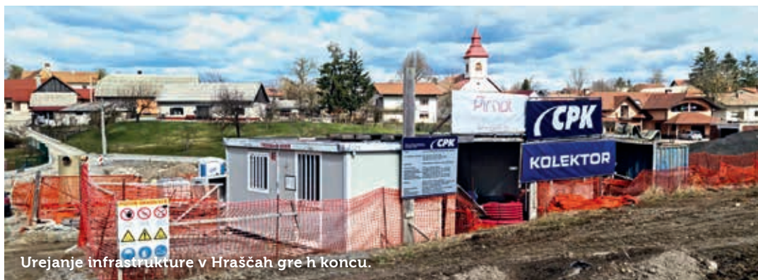
Urejanje infrastrukture v Hraščah gre h koncu.

Besedilo: Mateja Jordan; fotografija: Valter Leban.