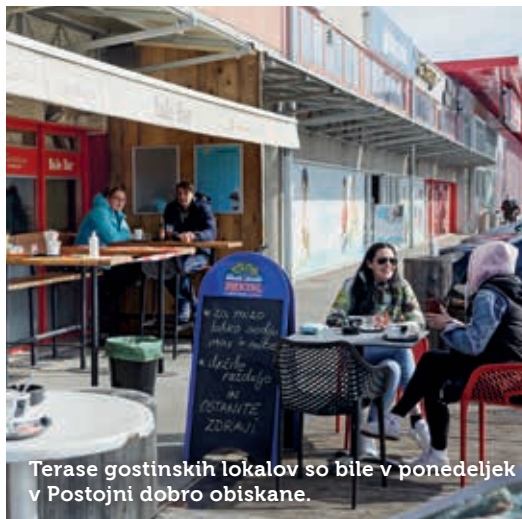
Terase gostinskih lokalov so bile v ponedeljek v Postojni dobro obiskane.