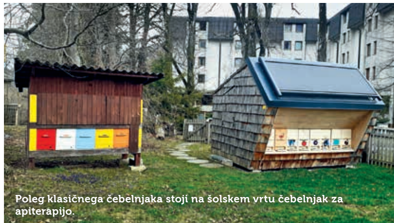
Poleg klasičnega čebelnjaka stoji na šolskem vrtu čebelnjak za apiterapijo.

Kolesarska čebelarska pot bo sledila že urejenim kolesarskim potem in bo vključevala tudi dodatno ponudbo – izposajo električnih koles, ogled hotelov za divje čebele ter delavnice za izdelavo sveč in mila iz čebeljega voska. Projekt, v celoti vreden 65.400 evrov, je v višini 47.400 evrov sofinanciran iz Evropskega kmetijskega sklada za razvoj podeželja.