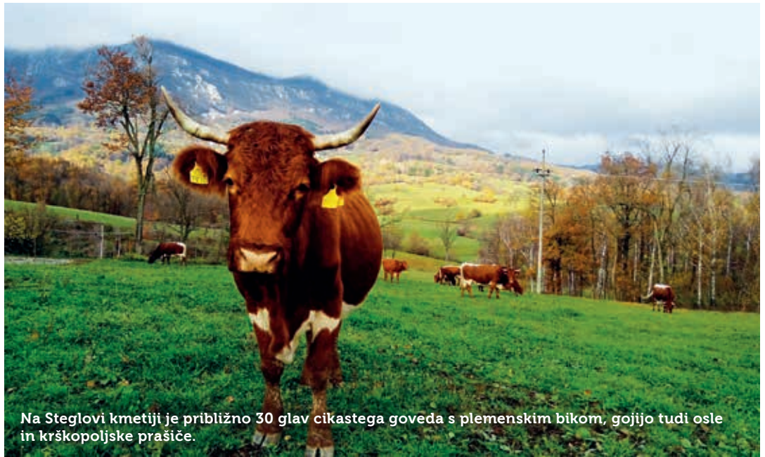
Na Steglovi kmetiji je približno 30 glav cikastega goveda s plemenskim bikom, gojijo tudi osle in krškopoljske prašiče.