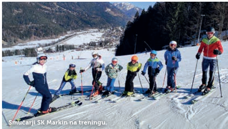
Smučarji SK Markin na treningu.